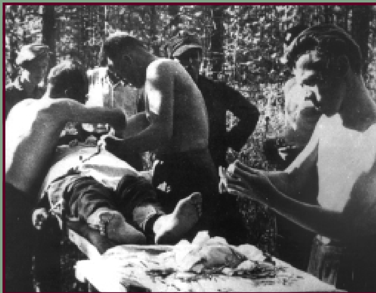
Zabieg operacyjny w partyzanckim szpitalu polowym