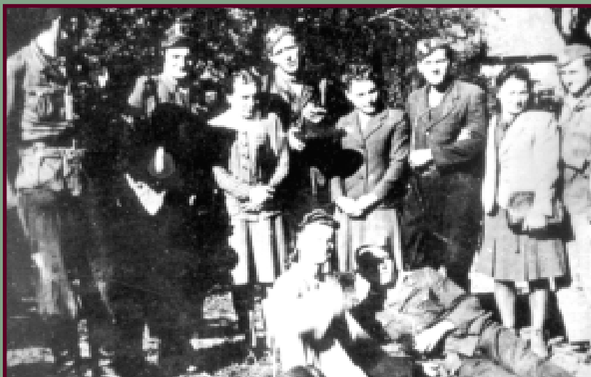
Sanitariuszki AK wśród partyzantów

W większości brygad służyli lekarze dyplomowani. W niektórych jednak obowiązki lekarzy pełnili studenci najstarszych lat tajnych kompletów medycyny.