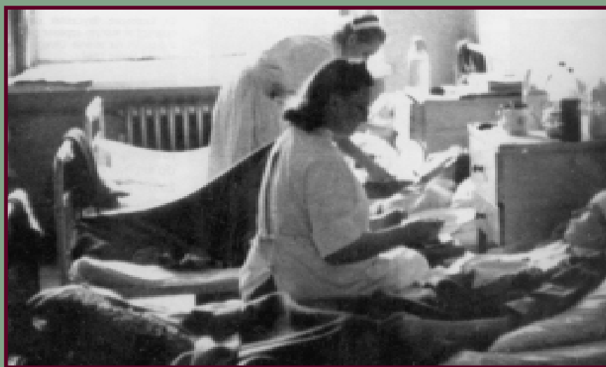
Żołnierz AK w szpitalu