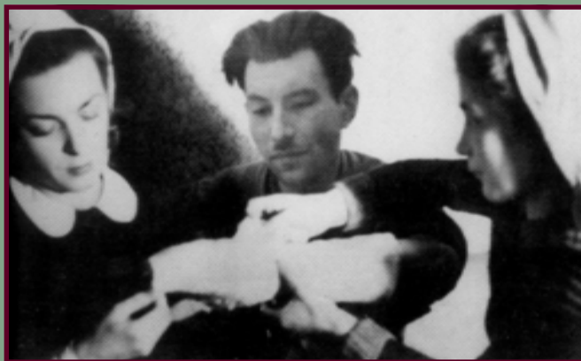
Opatrywanie rannego żołnierza

Jeśli zaś chodzi o przygotowanie lekarzy, to szacunkowe próby wskazują, iż w okupowanej Polsce w konspiracyjnych warunkach studiowało medycynę około 4000 studentów. Natomiast w prowadzenie tej nauki zaangażowany był ponad 500-osobowy personel dydaktyczny. Trudno ocenić jaki ich odsetek uczestniczył w działalności służby zdrowia AK. Z analizy materiałów źródłowych wynika, iż w Powstaniu Warszawskim oraz operacji „Ostra Brama” wzięli udział niemal wszyscy lekarze i studenci Warszawy, a także Wilna. W innych rejonach kraju walki nie rozwinęły się na tak dużą skalę, ale wszystkie oddziały AK posiadały należyte zabezpieczenie medyczne.