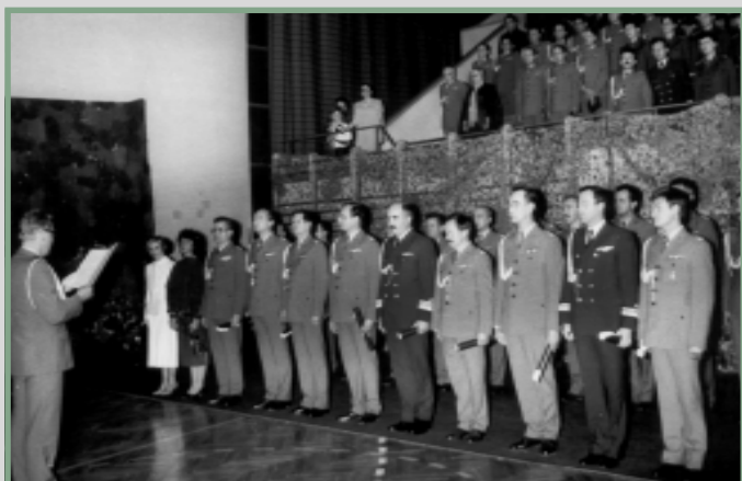
Plk doc. J. Goch